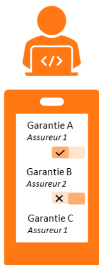
Des courtiers customisant l'offre

s'appuient sur les possibilités nouvelles offertes par les technologies pour pousser la personnalisation de l'offre jusqu'à un niveau encore rarement atteint, en créant sa propre API qui facilite la distribution des produits sur des plateformes en ligne.